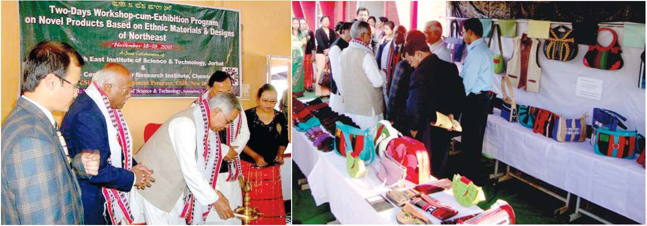
(बाएं) मुख्य अतिथि द्वारा दीप प्रज्वलन । (दायें) उत्तर-पूर्व के सजातीय डिजाइन पर आधारित विभिन्न उत्पादों का प्रदर्शन ।