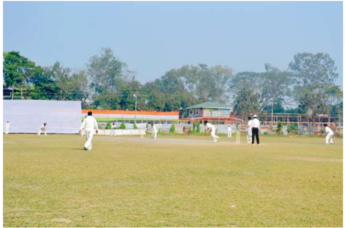
जेडीएसए ग्राउण्ड, जोरहाट में चल रहा एक क्रिकेट मैच