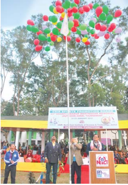
सीएसआईआर-एनईआईएसटी खेल परिसर में बॉलीबाल मैच के दौरान एक रोमांचक क्षण

उन्होंने सही भावना के साथ खेल खेलने के लिए खिलाड़ियों को प्रोत्साहित किया और उन्हें सद्भावना प्रदान की। समारोह की स्मृति में “प्रयास” नामक एक आकर्षक स्मारिका का मुख्य अतिथि द्वारा विमोचन किया गया तथा समारोह का उद्घाटन रंग-बिरंगे गुब्बारे उठाकर किया गया। तीन दिवसीय बाह्य टूर्नामेंट में क्रिकेट और बॉलीबाल मैच सम्मिलित थे जो सीएसआईआर – एनईआईएसटी खेल परिसर के अलावा अनेक स्थानों पर आयोजित किए गए जैसे कि जेडीएसए खेल परिसर, असम कृषि विश्वविद्यालय, खेल मैदान और जोरहाट जिमखाना क्लब खेल मैदान में आयोजित किए गए थे। प्रतिभागियों में, सीएसआईआर-एनसीएल, पुणे, सीएसआईआर – सीजीसीआरआई, कोलकाता, सीएसआईआर – एनपीएल, नई दिल्ली, सीएसआईआर-आईजीआईबी, नई दिल्ली, सीएसआईआर – एनएमएल जमशेदपुर, सीएसआईआर – सीआईएमएफआर, धनबाद, सीएसआईआर – सीबीआरआई, रूड़की, सीएसआईआर – सीएसआईओ, चंडीगढ़, सीएसआईआर-एमपीआरआई, भोपाल और सीएसआईआर मुख्यालय से खिलाड़ी सम्मिलित थे। इस अवधि के दौरान एक दैनिक बुलेटिन भी जारी किया गया जिसमें प्रत्येक दिन के कार्यकलापों पर प्रकाश डाला गया तथा अन्य रुचिकर घटनाओं के अलावा खेल क्षेत्र के समाचारों को शामिल किया गया।