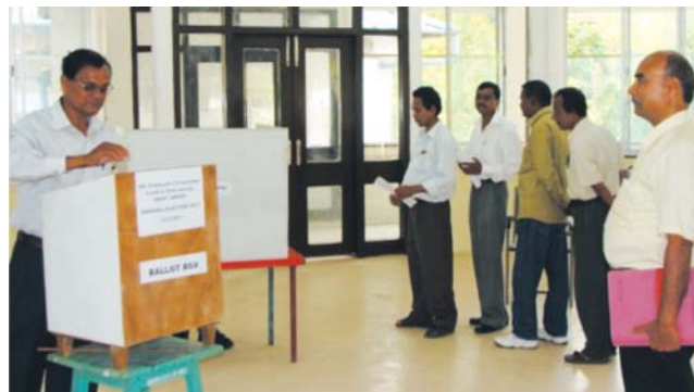
सोसायटी के शेयरधारी मतदान दिवस वाले दिन अपना वोट डालते हुए