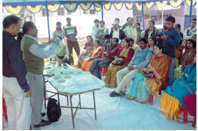
सीएसआईआर-एनईआईएसटी कार्मिक मशरूम खेती पर प्रतिभागियों को प्रदर्शन देते हुए।