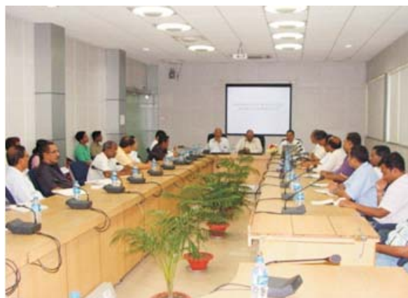
चल रहा संवादात्मक सत्र